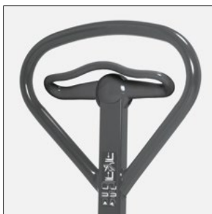
Leva di comando ergonomica