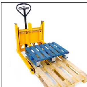
Preso di un semipallet da un Europallet standard