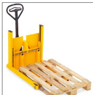
Prelievo di un Europallet standard